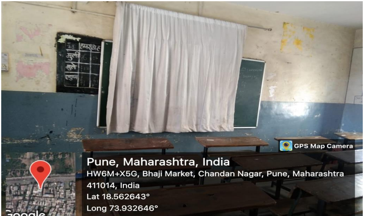
F.Y.B.A. Class Room.