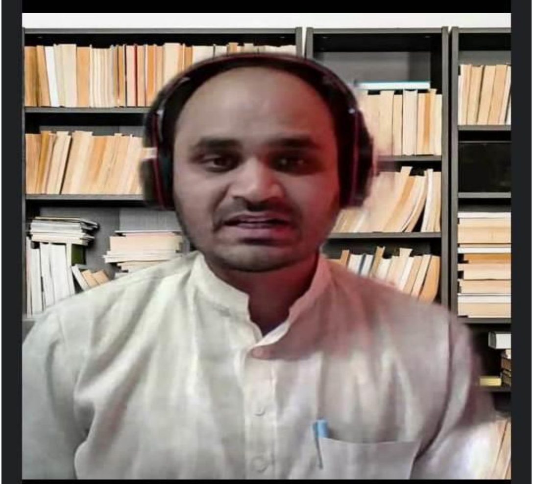
Prof. Kendre R.S. conducting online lecture during the Covid.